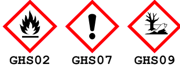
GHS02 GHS07 GHS09