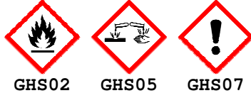
GHS02 GHS05 GHS07